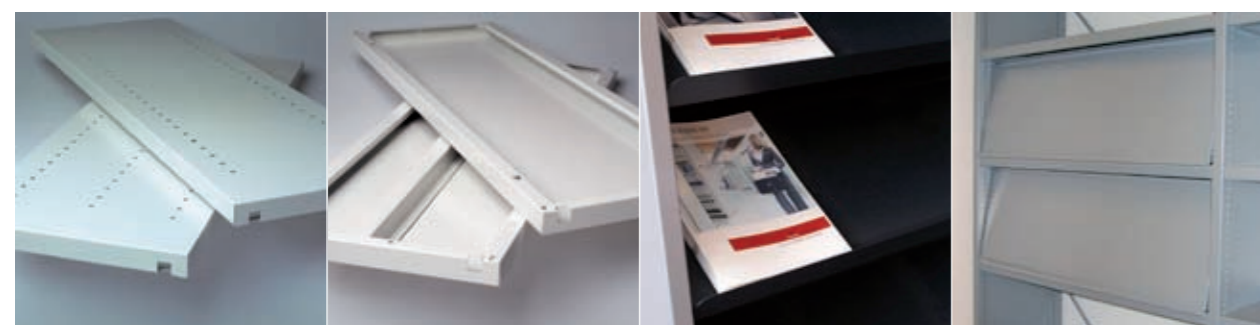
Fachboden, 2 oder 3 Lochreihen Verstärkungsrippe Zeitschriftenboden Display Klappboden

Zur Einrichtung von Facheinteilungen mit Hilfe von Fädelstäben oder Trennplatten aus Stahl. Zur Erhöhung der Belastbarkeit eines Fachbodens. Nur für Fachböden ab NT 350 mm. Zeitschriftenboden für die Präsentation von Dokumenten. Der Display Klappboden kombiniert Ausstellen und Lagern.