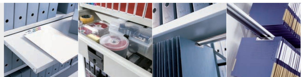
Auszugboden Schublade ZT-Pendelschiene für Hängemappen und CD Elba-Pendelschienen

Zur Schaffung eines hochstehenden Randes an der Vorder- oder Rückseite eines Fachbodens. Zur Schaffung eines hochstehenden Randes zwischen zwei Fachböden. Nur bei Doppelregalen zu benutzen. Verhindert das Herausfallen des Lagergutes. Zur Regalbeschriftung.