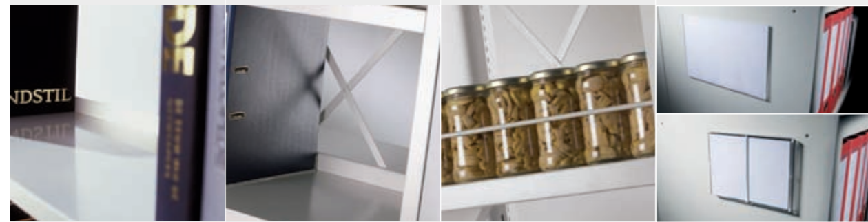
Fachbodenanschlag Mittelanschlag Front stop Etikettenträger A5 / A6

Zur Einrichtung von Facheinteilungen mit Hilfe von Fädelstäben oder Trennplatten aus Stahl. Zur Erhöhung der Belastbarkeit eines Fachbodens. Nur für Fachböden ab NT 350 mm. Zeitschriftenboden für die Präsentation von Dokumenten. Der Display Klappboden kombiniert Ausstellen und Lagern.