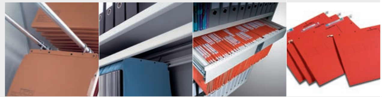
l'Oblique/ TUB-Rahmen Lateral Rahmen Hängeauszug Multi-file

Für den Gebrauch als Arbeitsplatte oder zum zeitweiligen Ablegen von Dokumenten oder kleinen Gegenständen. Nur für Regaltiefen mit NT 250 bis 450 mm. Zum Aufbewahren kleiner Gegenstände. In der Schublade können Facheinteilungen angebracht werden. Nur für Regaltiefen mit NT 300 bis 450 mm. Die Schubladen können mit verschiedenen Verschlussmechanismen ausgestattet werden. Für die Aufbewahrung lateraler Hängemappen vom Typ Zippel oder Jalema. Nur für Regaltiefen mit NT 350, 370, 390, 400 oder 450 mm. Auch für die Aufbewahrung von Jalema CD-Hängemappen. Nur für Regaltiefe NT 200 mm. Für die Aufbewahrung lateraler Hängemappen mit einer 1-Punkt-Aufhängung von Typ Elba, Leitz oder Pendex. Für Regaltiefen mit NT 350, 370, 390, 400 oder 450 mm. NT>450 mm nur auf Anfrage.